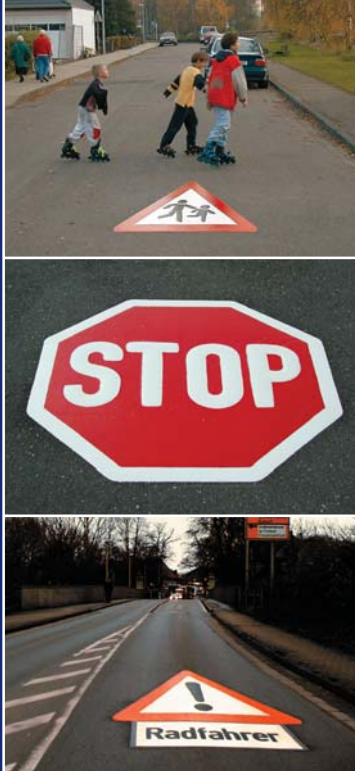
Farbige Verkehrszeichen und Symbole