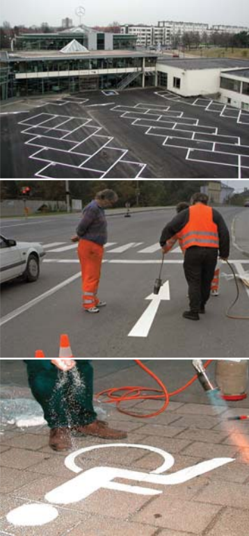
Linien, Pfeile, Buchstaben, Ziffern, Piktogramme, Logos