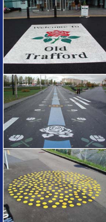
Firmenlogos, Sonderzeichen und -symbole