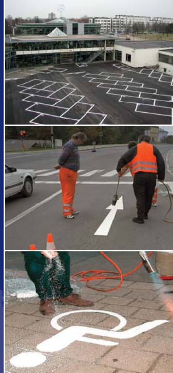
Linien, Pfeile, Buchstaben, Ziffern, Piktogramme, Logos

Management Service ISO 9001: 2000 Zertifikat Reg. Nr. 12 100 8827 TMS